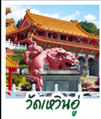
วัดเหวินอู๋