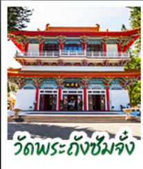
วัดพระถังซัมจั๋ง