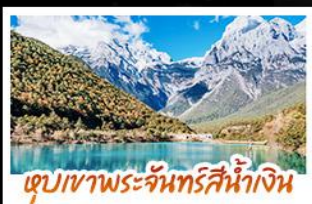
ทะเลสาบพระจันทร์สีน้ำเงิน