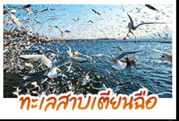
ทะเลสาบไต้ย่นฉือ