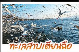
ทะเลสาบเตียนฉือ