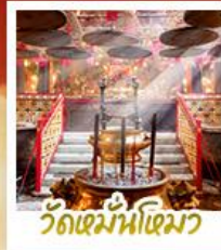
วัดเมฆน้ำเฒว