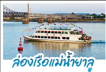
ล่องเรือแม่น้ำชาลู่