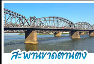
สะพานขาดสถานตง