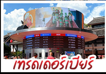
เทรดเดอร์เบียร์