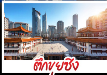
ตึกชยุซิง