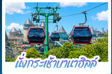
นั่งกระเช้านาฮิลล์