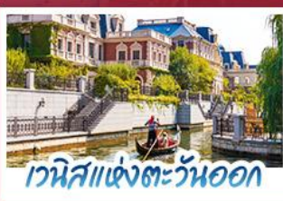
เวนิสแห่งตะวันออก