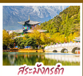
สระมัจกรดา