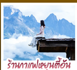
ร้านอาหารฟิชเชียนตี้ฮัน

ชมวิวกูเขาหิมะเหมยลี่สุดโรแมนติกกับแสงยามพลบค่ำ เที่ยวเมืองโบราณต้าหลี่ ลี่เจียง ไปซา แขงกรี่ล่า ชมวิถีชีวิตของชุมชนยูนนานและทิเบต พิสูจน์ความกล้าท้าเดินชมสะพานแกว่งลี่เจียง • ช้อปปิ้งเพลินที่ถนนคนเดินหนานผิงเจียง