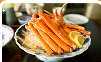
พิเศษ! ขาปู