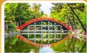
ศาลเจ้าซูมิโยชิ โทคะ