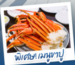
พิเศษ! เมฆหวนฟูจิ