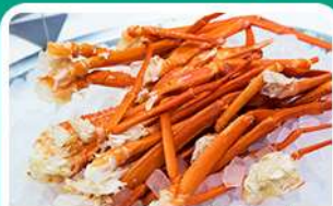
พิเศษ! บุฟเฟ่ต์ขาปู