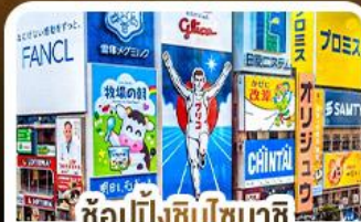
ช้อปปิ้งชินโซบาชิจิ