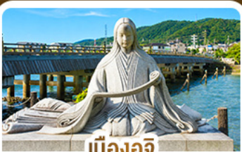
เมืองอูจิ สวรรค์คนรักชาเขียว