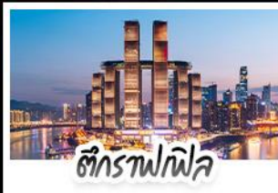
ตึกรูปไฟพล