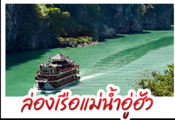
ล่องเรือแม่น้ำอู่ฮั่น

ฉงชิ่ง - อุหลง - เจียนเจียง หลุมฟ้าสามสะพานสวรรค์ - หงหยาดัง พุทธศิลป์ต้าจู้ - ล่องเรือแม่น้ำอู่ฮั่น