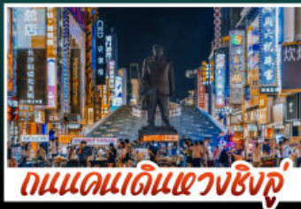
ถนนแดนแดนเซี่ยงชู่