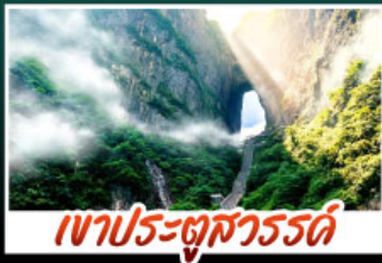
เขาประตูสวรรค์