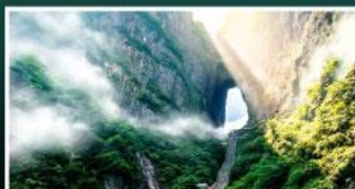
เขาประตูลี้สวรรค์