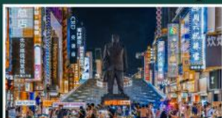
ถนนแดนดินแดนเซี่ยงหนิง