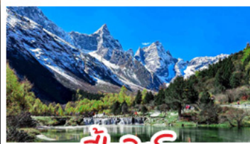
ป่าผิงโกว