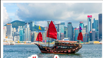
เมืองฮ่องกง

เมืองเก่าชิงเต่า - วิวเมืองฮ่องกง โรงเบียร์ชิงเต่า - ท่าเรือชาวประมงเยียนไถ