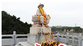
พระเจ้าตากสิน