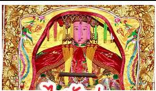
ไร่ตังมา

มรดกโลกบ้านดินถู่โหลว เตจิว - สะพานเซียงจิว ไร่ตังมา (เจ้าแม่กบกับทิม) - ไร่ยงบูชิว (เจ้าพ่อเสื่อ) พระเจ้าตากสินมหาราช - อวนน้ำแร่จากธรรมชาติ ไม้ลงร้านซ้อป - พักโรงแรม 4 ดาว เมนูพิเศษ!!! อาหารเตจิว 18 อย่าง, สุกี้ซีฟู้ด ห่านพะไลต้นตำรับเตจิว