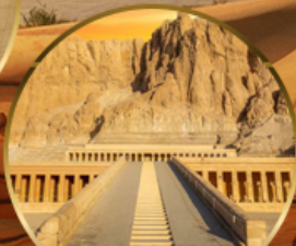
หุบเขากษัตริย์