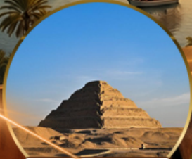
พีระมิดขั้นบันได

โคโร กิซา เมมฟิส อเล็กซานเดรีย พีพีรภัณฑ์แกรนด์อียิปต์ GEM