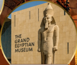
พีพีรภัณฑ์แกรนด์อียิปต์