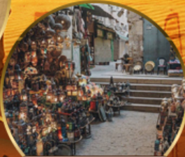
ตลาดบ้านเอลคาลิ