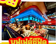
บุฟเฟ่ต์ซีฟู้ด