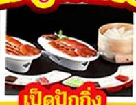
เปิดบ๊ักกิ้ง