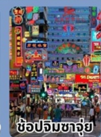
ช้อปปิ้งจตุรัส