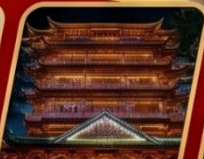
Dafo Buddhist temple