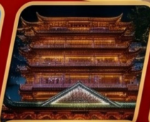
Dafo Buddhist temple