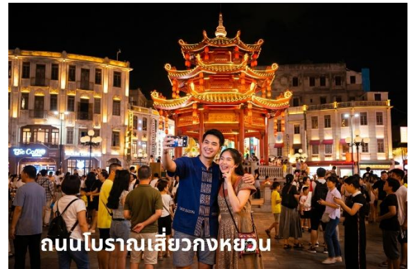
ถนนโบราณเสียวกงหยวน

จากนั้นนำท่านเดินทางสู่ ถนนโบราณเสียวกงหยวน เป็นถนนคนเดินสายโบราณของเมืองชัวเถา เป็นที่ตั้งของ Zhongshan Memorial Pavilion หรือ “ศาลาอนุสรณ์สถานจงซาน” และยังเป็นจุดนัดพบของคนที่นี่ รอบๆ เต็มไปด้วยร้านอาหาร และคาเฟ่หลายร้าน บรรยากาศคึกคัก อาคารต่างๆ มีเอกลักษณ์เหมือนได้ย้อนเวลากลับไปในเมืองจีนยุคเจ้าพ่อเซี่ยงไฮ้ เหมาะแก่การถ่ายรูปในมุมต่างๆสวยงาม