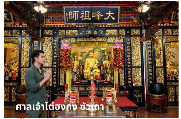
ศาลเจ้าไต้ฮงกง ชัวเถา

นำท่านสู่ ศาลเจ้าไต้ฮงกง (ปอเต็กตึ๊ง) นมัสการไต้ฮงกงอันเป็นที่นับถือของชาวจีนในเรื่องความเมตตากรุณาของท่าน ปัจจุบันสุสานแห่งนี้ได้รับการบูรณะซ่อมแซมจากการร่วมบริจาคของชาวจีน จนมีความใหญ่โตและสวยงามสถานที่ท่องเที่ยวแห่งนี้เกิดจากหลวงพ่อดำเพ็งจูซือ สมัยราชวงศ์ซ่ง ตามจดบันทึกของโบราณคดี ดำเพ็งจูซือเป็นคนสมัยราชวงศ์ซ่ง เกิดที่อำเภอเวินโจว มณฑลเจ้อเจียง สอบได้จิ้นสี่เป็นข้าราชการชั้นผู้ใหญ่แต่เห็นการปกครองและข้าราชการไม่ดี จึงออกบวชเป็นพระชุดงค์มาถึงหมู่บ้านเหอผิงหลี่มณฑลกวางตุ้ง ได้สร้างวัดสร้างโรงเรียนสร้างสะพานและช่วยรักษาโรคภัยไข้เจ็บให้แก่ชาวบ้านตลอดมา หลังมรณภาพชาวบ้านได้ฝังศพ ณ ที่เหอ ผิงหลี่ และสร้างศาลเจ้าไว้เพื่อเป็นการรำลึกถึงบุญคุณและความดีขององค์ ไต้ฮงกงผู้นี้