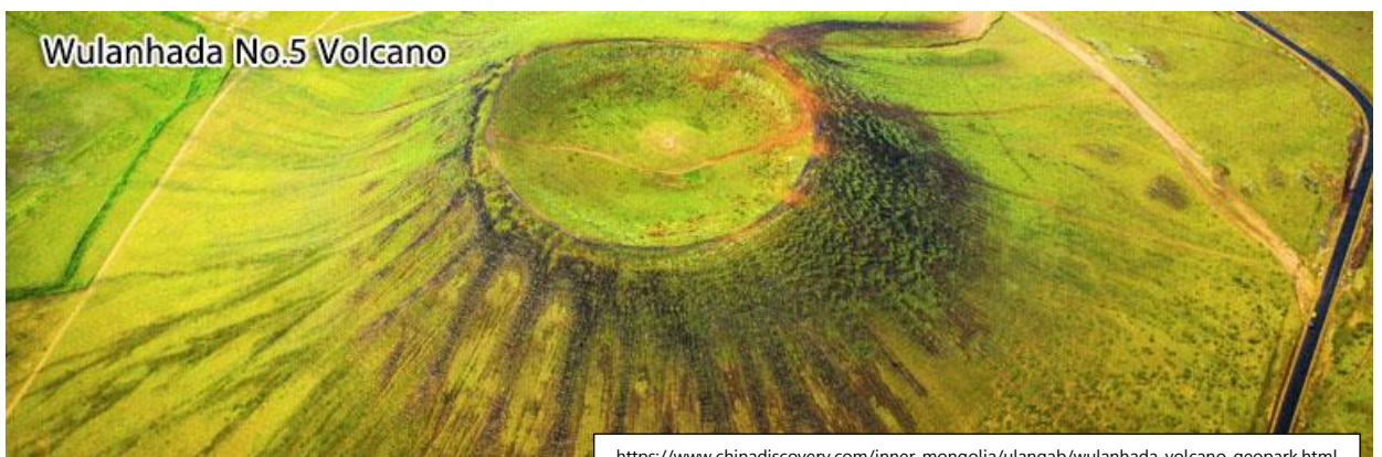
Wulanhada No.5 Volcano

หากมองมุมสูง จะเห็นปล่องภูเขาไฟกระจัดกระจายทั่วทุ่งหญ้าอันกว้างใหญ่ เมื่อหลายแสนปีก่อน แมกมาร้อนจากปล่องภูเขาไฟไหลล้นออกมาราวกับแม่น้ำ เหลือเชื่อความรุนแรงคือความงามอันยิ่งใหญ่ของโลก