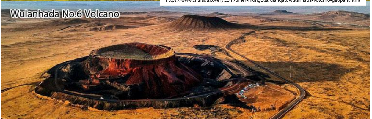
Wulanhada No.6 Volcano

https://www.chinadiscovery.com/inner-mongolia/ulanqab/wulanhada-volcano-geopark.html