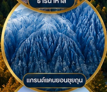
แกรนด์แคนยอนชุยถุน