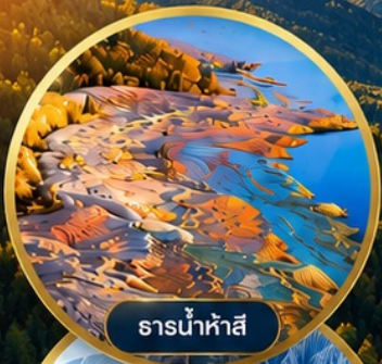
ธารน้ำห้ำสี