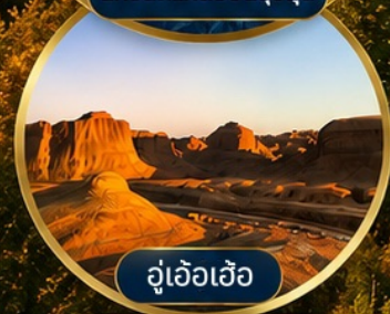
อู่เอ้อเอ้อ