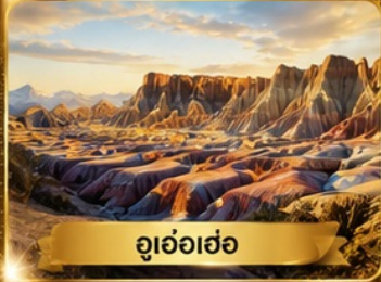
อุ่อเอ่อ