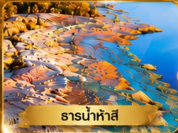
ธารน้ำห้ำสี