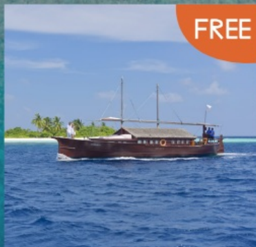
Safari Boat Trip