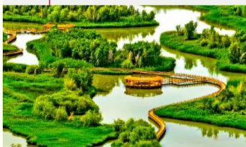
อุทยานพื้นที่ชุ่มน้ำจางเย่