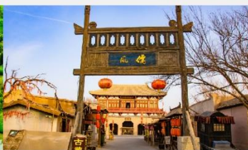
เมืองโบราณตุนหวง