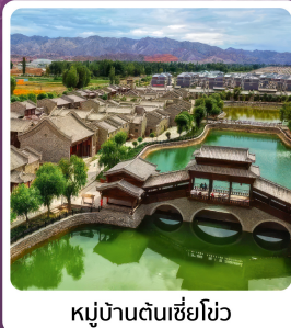
หมู่บ้านตันเซี่ยชิว