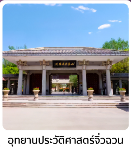
อุทยานประวัติศาสตร์จี้วฉวน

อาหารมื้อพิเศษ ใต้ต้นหม้อไอน้ำ ซีโครงหม้อไอน้ำโตลิกันโจว