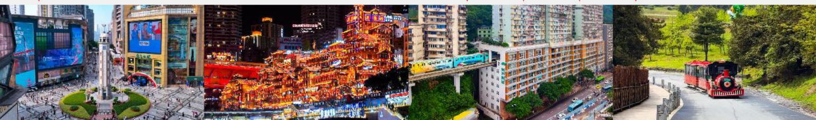
ถนนเจี๋ยฟางเป่ย์