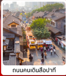
ถนนคนเดินสี่牌坊