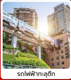
รถไฟฟ้าทะลุถ้ำ

ไฮไลท์อุทยานแห่งชาติหลุมฟ้า 3 สะพานสวรรค์มรดกโลกระดับ 5 A ชมไฟยามค่ำคืนของสถาปัตยกรรมจีนโบราณ หงหยาดัง