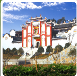
บ้านเกิดชวีหยวน