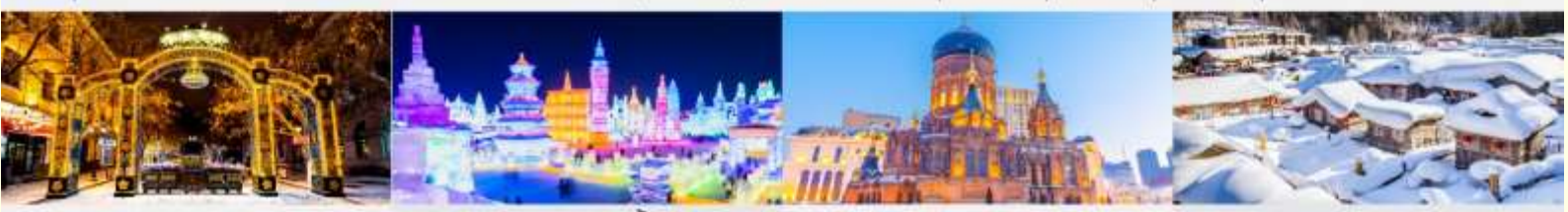
ถนนคนเดินจงหยาง เทศกาลโคมไฟน้ำแข็ง โบสถ์เซนต์โซเฟีย หมู่บ้านหิมะ

*ทางบริษัทฯ ขอสงวนสิทธิ์ในการสลับโปรแกรมทัวร์ตามความเหมาะสมขึ้นอยู่กับสถานการณ์หน้างาน โดยคำนึงถึงผลประโยชน์ของลูกค้าเป็นสำคัญ