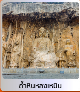
กำแพงเหลืองหิน