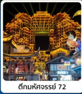
ตึกหัตถจารย์ 72