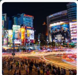
ตลาดกลางคืนซินเหมินตง