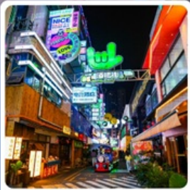
ถนนคนเดินซินเหยียน