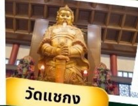
วัดเขากง