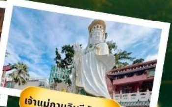
เจ้าแม่กวนอิมริฟลัสเบย์