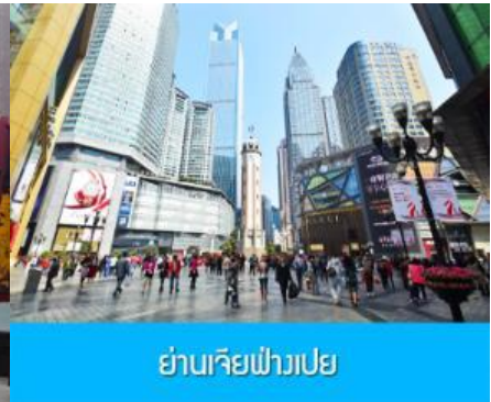
ย่านเจียฟางเปย