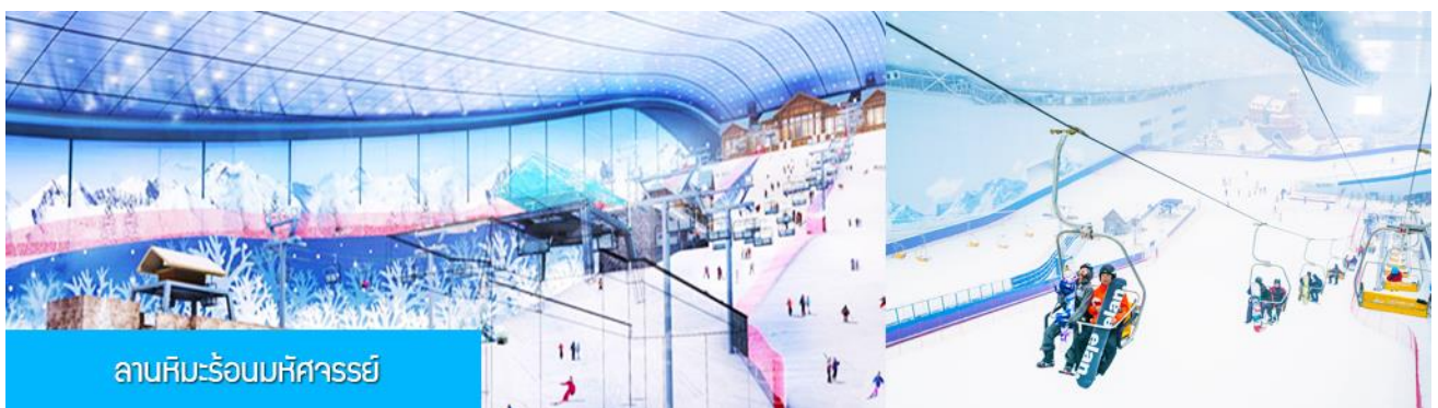
ลานหิมะร้อนมหัศจรรย์

หรือท่านสามารถเลือกซื้อ โปรแกรมเสริม บัตรเข้าชม ลานหิมะร้อนมหัศจรรย์ (ลานสกีในร่มที่ใหญ่ที่สุดของโลก) 哈尔滨热雪奇迹