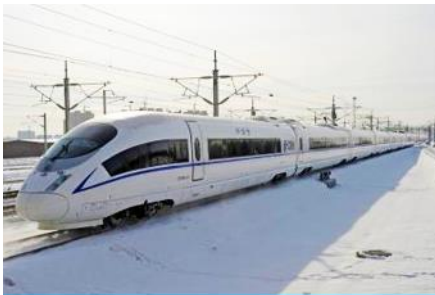
รถไฟความเร็วสูง

พักที่ HARBIN REZEN HOTEL โรงแรมระดับ 4 ดาวท้องถิ่นหรือเทียบเท่า ในเมืองฮาร์บิน