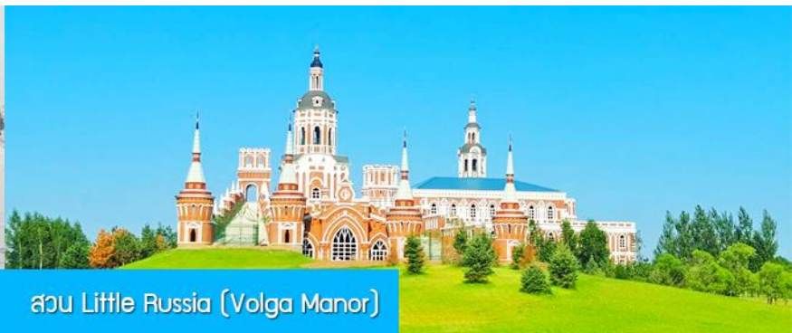
สวน Little Russia (Volga Manor)