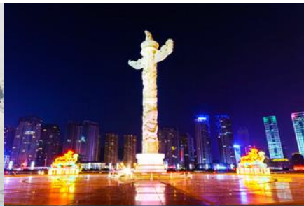
จัตุรัสชิงไห่