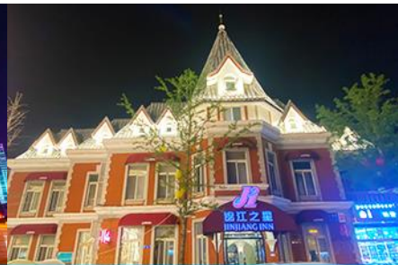
ถนนรัสเซีย