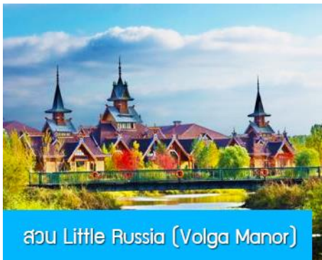
สวน Little Russia (Volga Manor)