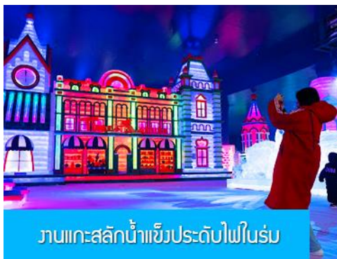
งานแกะสลักน้ำแข็งประดับไฟในร่ม