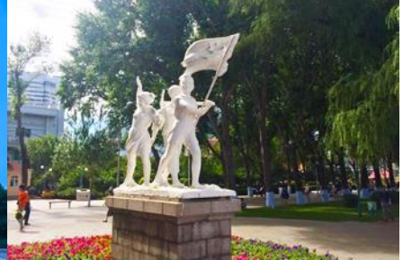
สวนสตาลิน

วันที่ 1 เมืองฮาร์บิน – ศูนย์การค้าว๋านต้า – (สามารถเลือกซื้อโปรแกรมเสริมลานหิมะร้อนมหัศจรรย์) อนุสาวรีย์ป้องกันอุทกภัย - สวนสตาลิน – ถนนคนเดินจงยั้งต้าเจีย POP MART