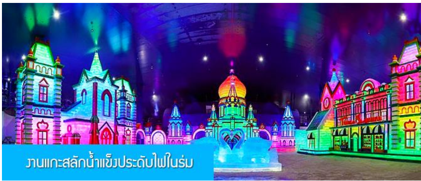
งานแกะสลักน้ำแข็งประดับไฟในร่ม