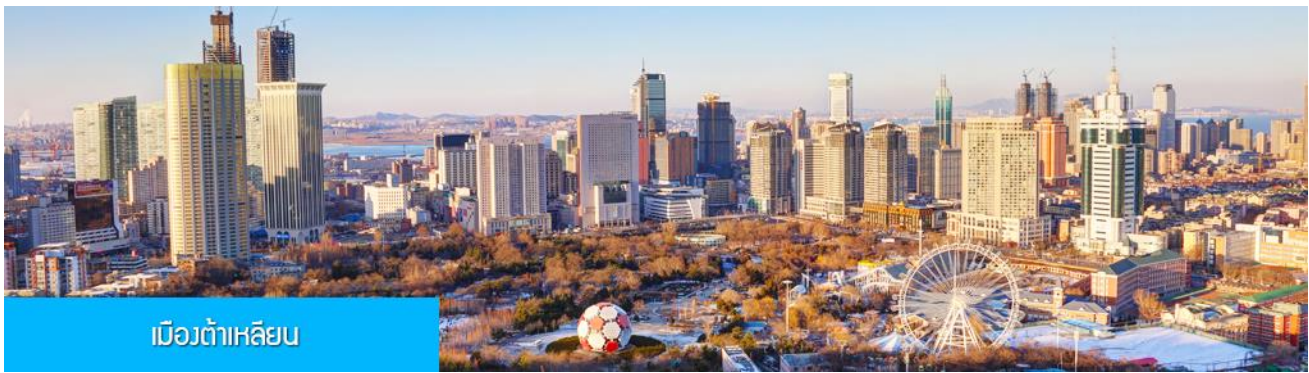
เมืองต้าเหลียน