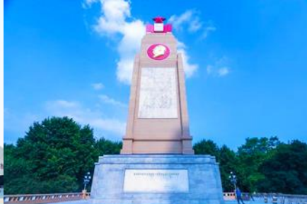
อนุสาวรีย์ฟิงหวง