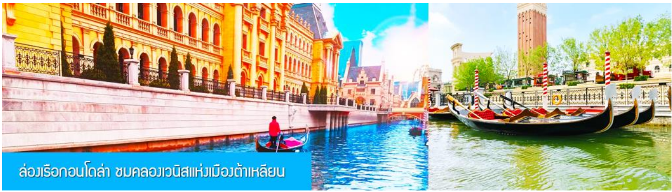
ล่องเรือกอนโดลา ชมคลองเวนิสแห่งเมืองต้าเหลียน