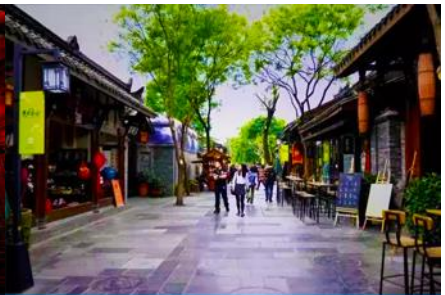
ซอยกว้าง ซอยแคบ และซอยบ่อน้ำ

พักที่ SERENGTI HOTEL 4* หรือ โรงแรมระดับเดียวกัน เฉิงตู