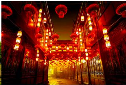
ถนนโบราณสถานจิ้นหลี่