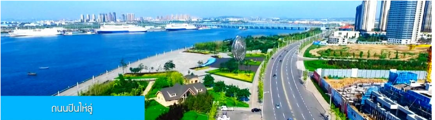
ถนนปินไห่ลู่

ล้อมด้วยตึกระฟ้าที่ทันสมัย ภายในมีบ่อน้ำพุดนตรี ลานหญ้าขนาดใหญ่ และลานกว้างสำหรับจัดกิจกรรม กลางแจ้ง อาทิ เทศกาลเบียร์นานาชาติ การแข่งขันวิ่งมาราธอน งานแฟชั่นนานาชาติเมืองต้าเหลียน ฯลฯ