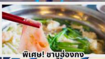
พิเศษ! ชาบูฮ่องกง