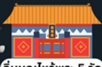
อิมบูนไหว้พระ 5 วัด