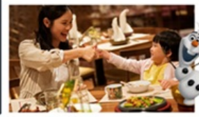
อาหารเข้าในห้องพักอาหารดิสนีย์