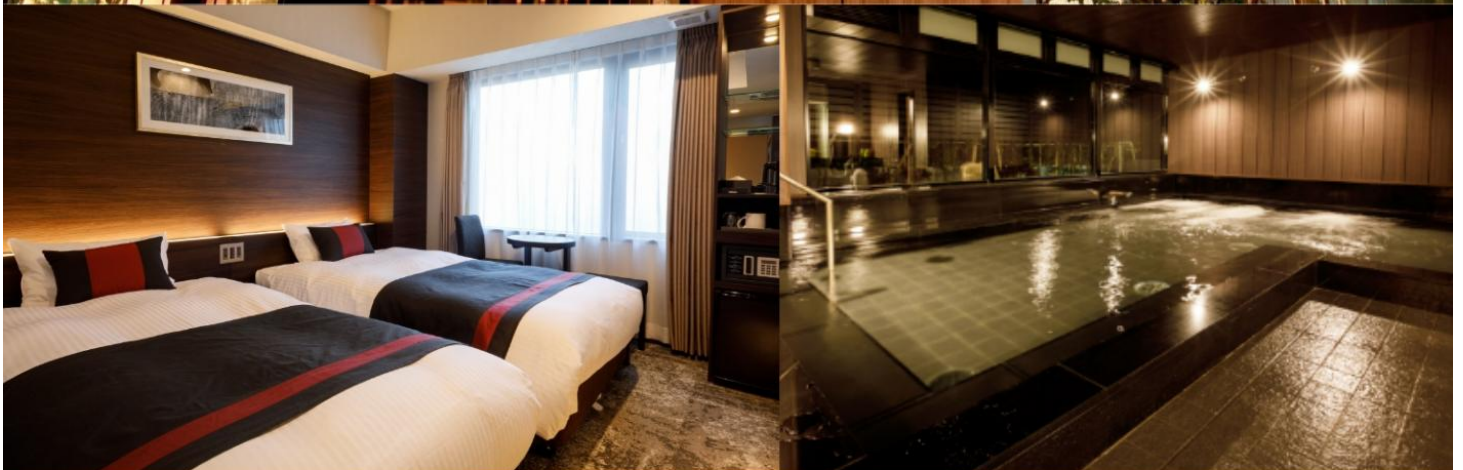
Standard Twin Room 16-17 sqm