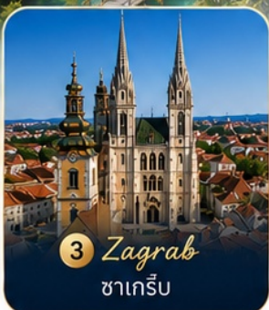
3 Zagreb ซาเกร็บ