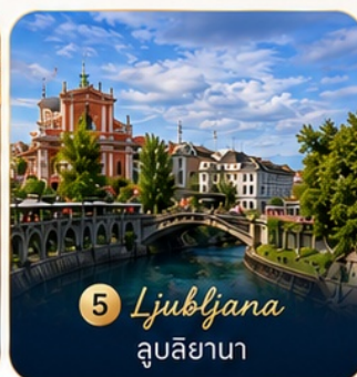
5 Ljubljana ลูบลียานา