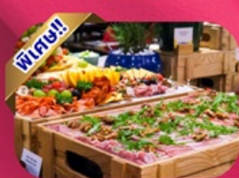
Buffet Dinner Banahill