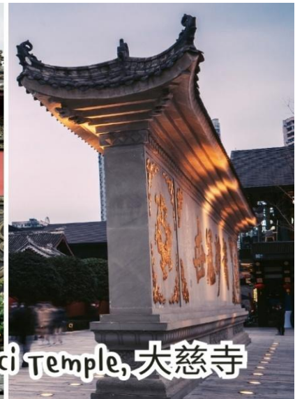
Daci Temple, 大慈寺

ถนนคนเดินไท่กุ๋หลี่ ช้อปปิ้งคอมเพล็กซ์ ร้านอาหาร ห้างสรรพสินค้าใต้ดิน โรงภาพยนตร์ จัตุรัส และ โรงแรมหรูอย่าง The Temple House ท่านจะได้สัมผัสวิถีชีวิตสไตล์จีนโมเดิร์นที่ผสมผสานกันอย่างลงตัว ที่มีทั้งสินค้าไฮ้ฮอด้ง สินค้าของจีนและของที่ระลึกให้ท่านเลือกสรร นำท่านช้อปปิ้งถนนคนเดิน ซุนซีลู่ ซึ่ง เป็นย่านวัยรุ่น และขายสินค้าที่ทันสมัย ทั้งสินค้าแบรนด์เนมและช้อปปิ้งเสื้อผ้า รองเท้า กระเป๋า รวมถึงร้าน ขายของกินมากมาย เป็นถนนที่ปิดไม่ให้อารถสามารถวิ่งผ่านได้นำท่านไปช้อปปิ้งต่อที่ย่าน นำท่านชมจุด