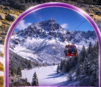
อุทยานต้ากู่ปิงชว่น (รวมรถอุทยาน+กระเช้า)

พิเศษ สุขี่หม่าล่า !! พร้อมน้ำจิ้มรสเด็ด