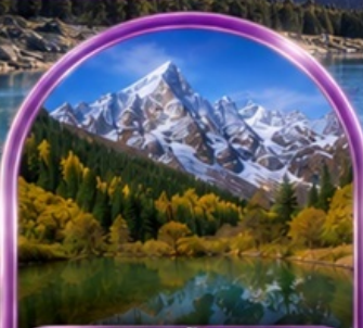
อุทยานปี้ผิงโกว (รวมรถกอล์ฟ)