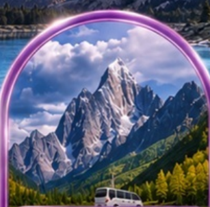
อุทยานสีดรุณี (รวมรถอุทยาน)