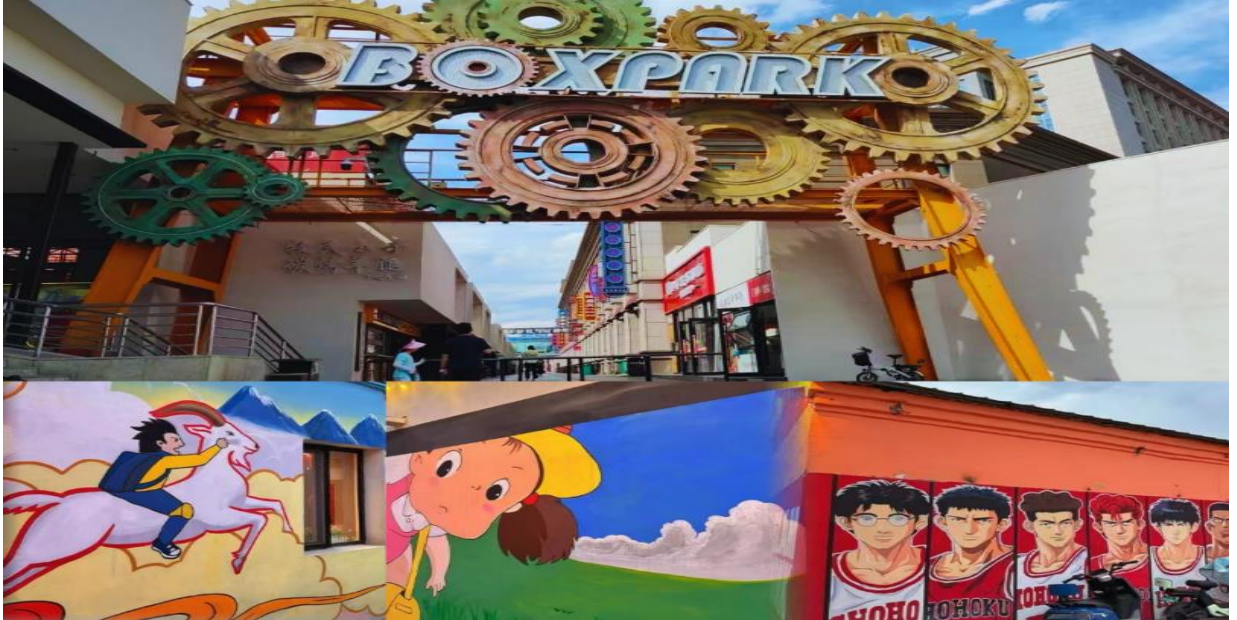
อิสระอาหารค่ำตามอรัยาศัย

จากนั้นนำท่านเดินทางไปยังถนนคนเดินคังปาสือ (Kangbashi Walking Street) ถนนสายวัฒนธรรมผสมผสานมนต์เสน่ห์ของวัฒนธรรมมองโก บริเวณรอบ ๆ มีอาคารบ้านเรือน สถาปัตยกรรมสมัยราชวงศ์หมิงและชิง เป็นศูนย์รวมของความเป็นถิ่น ร้านค้าและร้านอาหาร แหล่งรวมอาหารหลากหลายประเภท อาหารพื้นเมืองมองโก เนื้อแกะย่าง, ซีสมม, อาหารเสฉวน, อาหารหูหนาน ฯลฯ