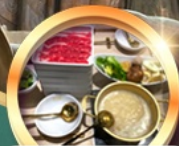
บุฟเฟ่ต์ชาบู เมื่อบริไม้อัน!!