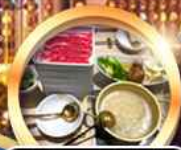
บุฟเฟ่ต์ชาบู เบื่อไม่อั้น!!